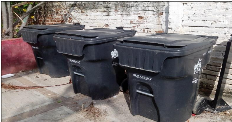
Jardín La Cofradía